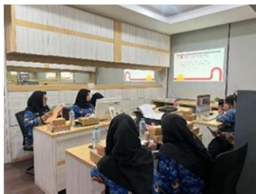
Gambar 4. Kegiatan BIMTEK