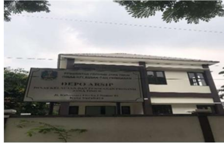
Gambar 2. Depo Arsip Kebonsari