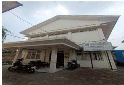
Gambar 3. Depo Arsip Pagesangan

Gambar diatas menunjukkan depo arsip, dalam praktik pengelolaan arsip, DKP Provinsi Jawa Timur telah menyediakan lokasi khusus untuk penyimpanan arsip inaktif sebagai bagian dari sistem kearsipan institusional. Lokasi penyimpanan arsip berada di dua tempat, yaitu Gedung Depo Arsip Kebonsari dan Gedung Depo Arsip Pagesangan. Kedua gedung tersebut berfungsi sebagai record center yang digunakan untuk menyimpan arsip inaktif dari seluruh bidang, UPT, dan cabang dinas di lingkungan DKP Provinsi Jawa Timur. Keberadaan record center ini mendukung pelaksanaan penyusutan arsip melalui kegiatan pemindahan arsip inaktif dari unit pengolah ke unit kearsipan, sekaligus menjamin keamanan fisik arsip serta memudahkan pengendalian dan penelusuran arsip ketika diperlukan.