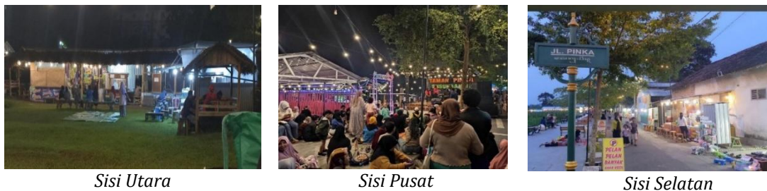
Gambar 1. Perbedaan Tingkat Keramaian Sisi Utara, Tengah, dan Selatan Taman Pinka Sumber: Dokumentasi Peneliti, 2026

Temuan tersebut menunjukkan bahwa upaya menciptakan iklim usaha melalui pembukaan akses ekonomi telah berjalan, namun masih memerlukan penguatan pada aspek pemerataan kesempatan. Menurut Kartasasmita (1996), enabling merupakan upaya menciptakan kondisi dan kesempatan yang memungkinkan masyarakat mengembangkan potensi yang dimiliki melalui akses dan peluang yang setara. Dalam konteks Taman Pinka, kesempatan berusaha telah diberikan kepada masyarakat lokal maupun luar desa sehingga potensi ekonomi masyarakat dapat berkembang. Namun, konsentrasi pengunjung pada titik tertentu menunjukkan bahwa distribusi manfaat ekonomi belum sepenuhnya merata. Oleh karena itu, aspek enabling masih perlu diperkuat melalui pengelolaan kawasan yang mampu mendorong persebaran aktivitas pengunjung secara lebih seimbang.