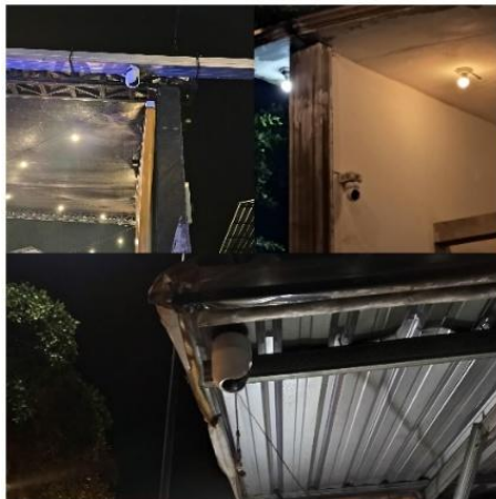
Gambar 6. Kamera CCTV di Taman Pinka

keamanan, serta kamera pengawas (CCTV) yang dipasang di beberapa titik kawasan. Kehadiran petugas keamanan dan CCTV bertujuan untuk menjaga ketertiban, mengawasi aktivitas di kawasan wisata, serta memberikan rasa aman bagi pengunjung dan pelaku UMKM. Sistem keamanan tersebut juga didukung melalui mekanisme retribusi yang sebagian digunakan untuk mendukung operasional keamanan kawasan. Dengan demikian, keamanan menjadi bagian yang tidak terpisahkan dari pengelolaan Taman Pinka.