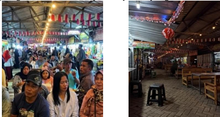
Gambar 4. Perbedaan Tingkat Keramaian saat Live music dan Hari Biasa

Meskipun demikian, hasil penelitian menunjukkan bahwa kemandirian usaha pelaku UMKM masih dipengaruhi oleh berbagai faktor eksternal. Tingkat kunjungan dan pendapatan pedagang cenderung meningkat ketika terdapat kegiatan live music di malam Minggu yang menjadi daya tarik utama kawasan wisata. Sebaliknya, pada hari biasa jumlah pengunjung relatif lebih sedikit sehingga aktivitas penjualan mengalami penurunan. Selain itu, kondisi cuaca, terutama hujan, juga berpengaruh terhadap jumlah pengunjung dan aktivitas ekonomi di kawasan Taman Pinka. Ketergantungan terhadap hiburan dan kondisi cuaca menunjukkan bahwa keberlangsungan usaha belum sepenuhnya ditopang oleh kekuatan usaha itu sendiri.