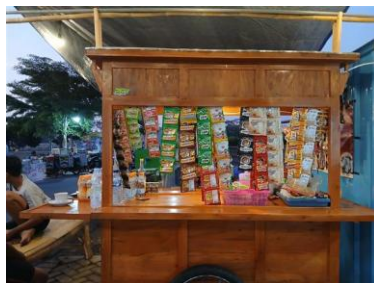
Gambar 2. Gerobak Usaha yang dipinjamkan BUMDes Kepada UMKM

Penyediaan lapak usaha merupakan bentuk nyata dukungan yang diberikan pengelola Taman Pinka kepada pelaku UMKM. Hasil penelitian menunjukkan bahwa pelaku UMKM tidak hanya memperoleh tempat untuk berjualan, tetapi juga mendapatkan sarana pendukung berupa gerobak usaha yang dapat dipinjam dan digunakan dalam menjalankan aktivitas usaha. Ketersediaan lapak dan gerobak usaha tersebut memberikan kemudahan bagi masyarakat yang ingin memulai usaha tanpa harus menyediakan seluruh sarana usaha secara mandiri. Kondisi ini membantu mengurangi hambatan awal yang sering dihadapi masyarakat dalam memulai kegiatan ekonomi. Dengan adanya fasilitas tersebut, masyarakat memiliki kesempatan yang lebih besar untuk terlibat dalam aktivitas usaha.