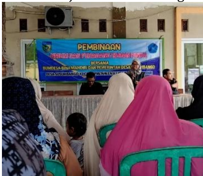
Gambar 3. Pembinaan dan Pelatihan UMKM

menyelenggarakan kegiatan pelatihan bagi pelaku UMKM di Taman Pinka. Beberapa narasumber menyampaikan bahwa pelatihan dilakukan melalui pertemuan yang menghadirkan pihak desa maupun Dinas Pariwisata untuk memberikan motivasi dan pengetahuan mengenai pengelolaan usaha. Selain itu, Direktur BUMDes juga menjelaskan bahwa pelatihan yang pernah diberikan berupa pelatihan pembuatan jajanan atau kue kekinian. Keberadaan pelatihan tersebut menunjukkan adanya upaya untuk meningkatkan kemampuan pelaku UMKM dalam menjalankan dan mengembangkan usaha mereka.