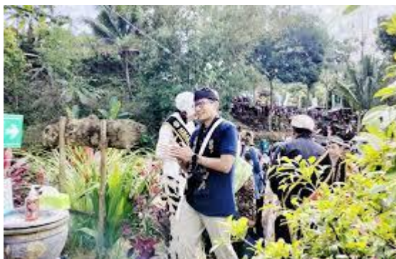
Gambar 2. Tinjau Desa Wisata Watu Kandang Trenggalek

Desa pandean juga memiliki potensi budaya yang luar biasa. Kothek an lesung yang ada sejak zaman penjajahan hingga kini masih dilestariakan. Usia lesung kurang lebih 150 tahun. Sedangkan pemukul lesung adalah ibu - ibu lansia yang energik memainkan alunan musik ritmik. Ada juga terbangan ello yang sudah langka, memakai alat semacam rebana, jedor dan kendang panjang yang unik Musik tradisional ini menjadi istimewa karena di mainkan oleh 8 orang laki - laki yang sudah lansia namun memiliki alunan suara (vocal) yang melengking tinggi yang dinamakan ngelik. Tidak semua orang bisa membawakan vocal terbangan ini, karena perlu teknik yang tinggi Salah satu potensi budaya yang terus berkembang adalah seni karawitan, di sini karawitan dimainkan oleh sekelompok lansia dengan gending gending asli tempo dulu (klenengan) sehingga sangat cocok dalam suasana alam pedesaan.