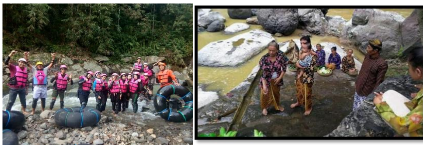
Gambar 3 Wisata Watu Kandang, Prosesi Mitoni dan River Tubing

Untuk meningkatkan daya tarik wisata tentu ada atraksi wisata yang ingin dikembangkan di Desa Wisata Pandean. Saat ini Desa Wisata Pandean sedang mengembangkan rencana pengembangan salah satunya MENINGKATKAN WISATA EDUKASI DAN OUTBOND (IKM). Tapi untuk saat ini semuanya masih dalam tahap Pengembangan, untuk Meningkatkan Wisata Edukasi Dan Outbond (IKM).